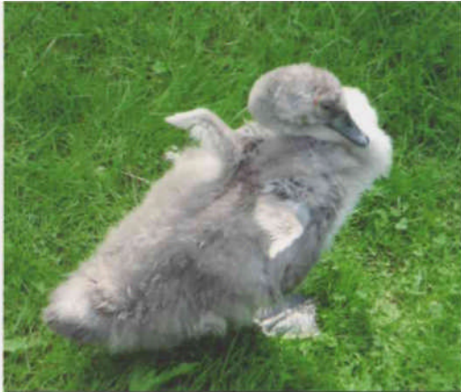
VesleFrikk i aug. 2009, små vinger gror fram!