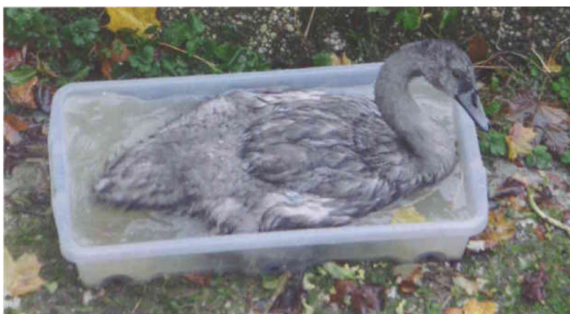
1 1.oktober 2009 Veslefrikk.

Katten Arrto i nabohuset, som bare pleier å gå opp trappa til kjøkkenet mitt og spise, skjønnte det var noe nytt i huset og kom seg ut på verandaen der Veslefrikk var, og begynte å kjekke seg!