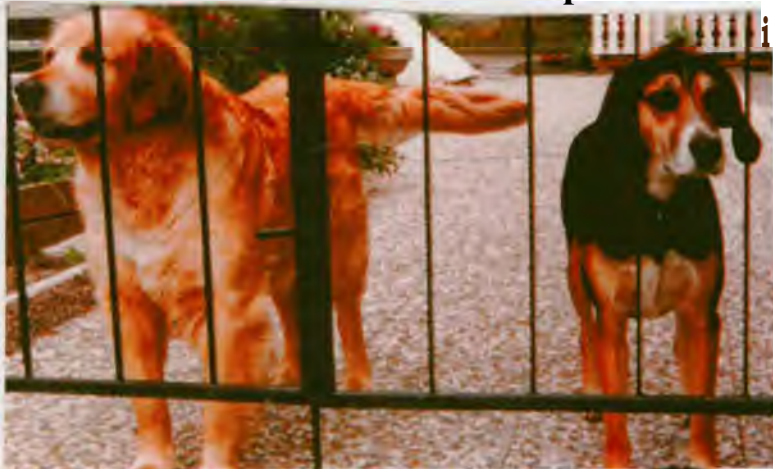
2 glade gutter, Ero og Prins