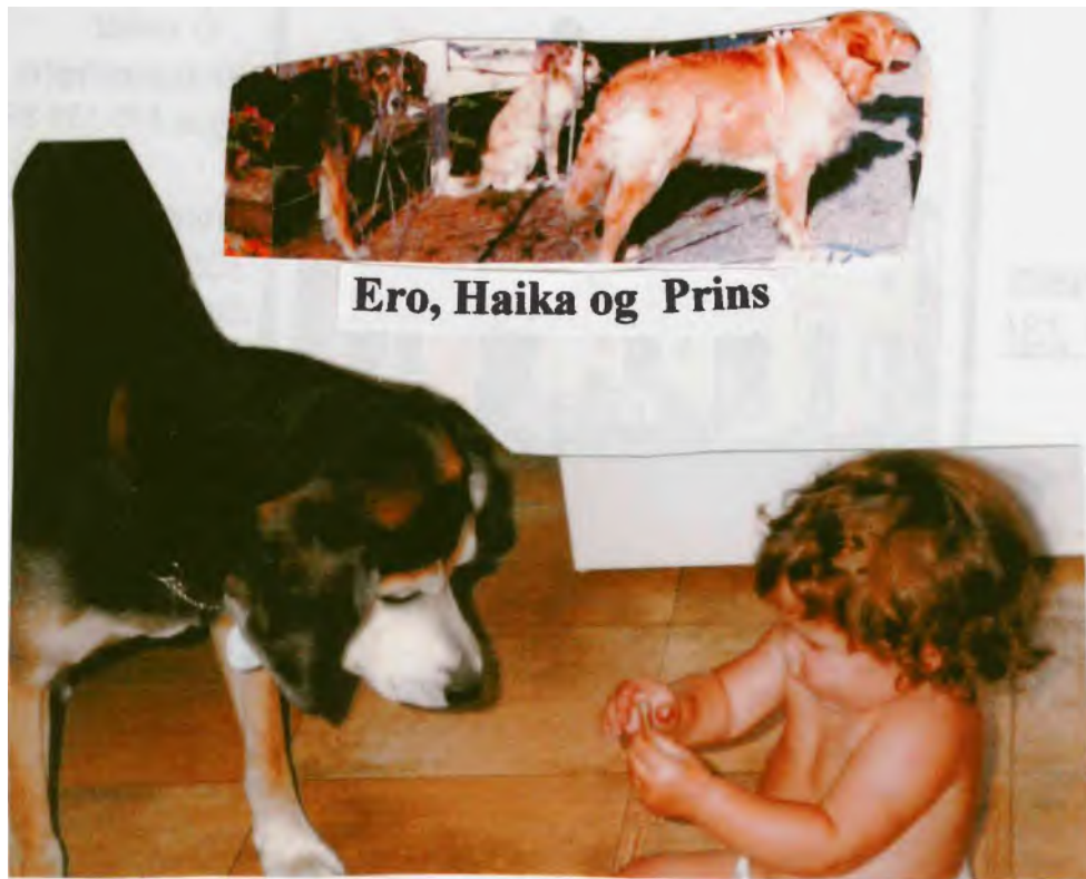
Ero, Haika og Prins